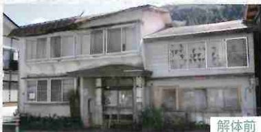
空き家を解体して街の駐車場に整備