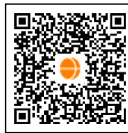
元気づくり支援金

令和7年度事業の募集期間は令和7年2月3日(月)まで です。支援内容、申請方法などの詳細はホームページをご覧ください。