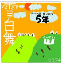
パッケージ (おにぎり君) .png