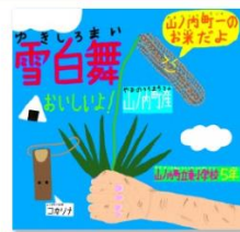
パッケージ指持っている.jpg