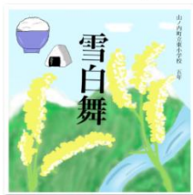
雪白舞パッケージ (山米) .jpg