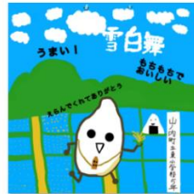
雪白舞パッケージ (田んぼ米君) .jpg